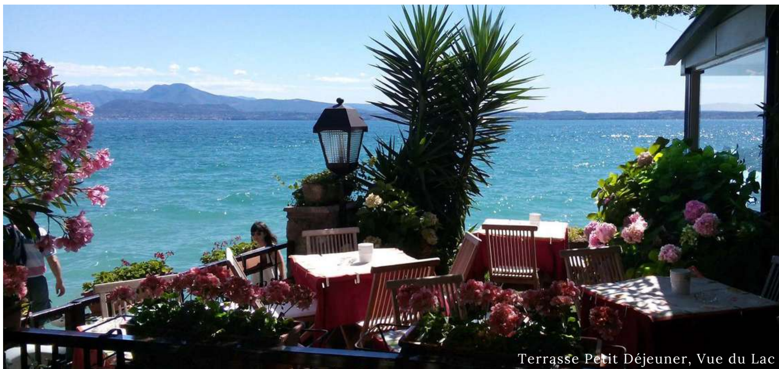
Terrasse Petit Déjeuner, Vue du Lac