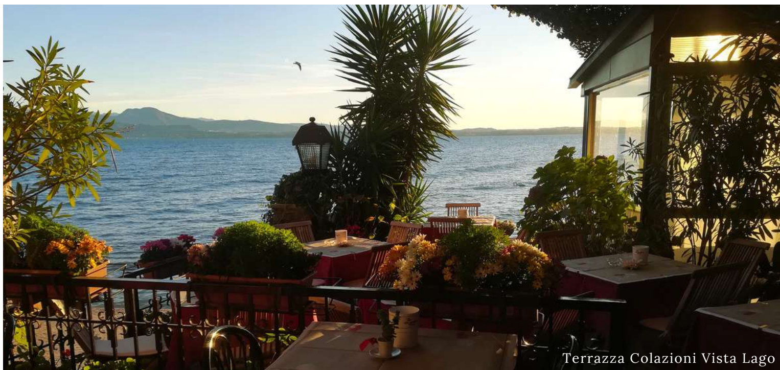
Terrazza Colazioni Vista Lago